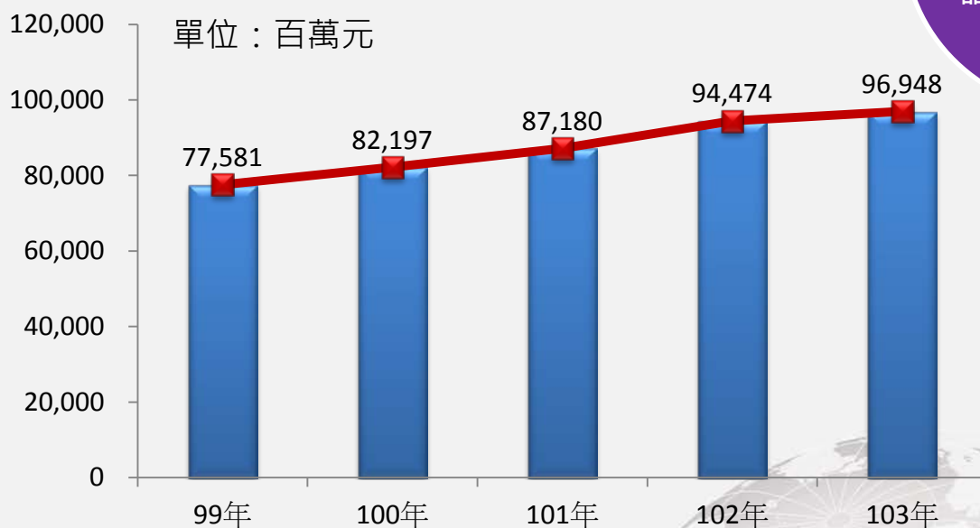
圖 3 99 年~103 年我國藥品製造業之總體營收

在營收方面，98 年因 H1N1 新型流感疫情流行，再加上現代人健康意識觀念越來越強烈，開始讓民眾有預期及預防的心理作用，會使用藥品來達到自我照護之目的，因此藥品製造業總體營收在當時大幅回升，而後的五年（99~103 年）亦呈現穩定增加趨勢，其中在 102 年又較 101 年成長了約 8 個百分點，營收突破 900 億元，而直至 103 年上升幅度有趨緩現象，約在 2% 左右，總營收為 969.5 億元。