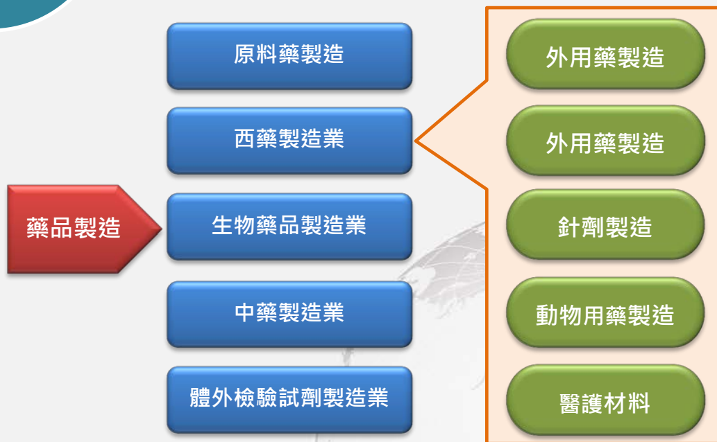
圖 1 藥品製造業分類

西藥製造業、生物藥品製造業、中藥製造業及體外檢驗試劑製造業等細業，其中，西藥製造業涵蓋口服用藥製造、外用藥製造、針劑製造、動物用藥製造及醫護材料等範疇。